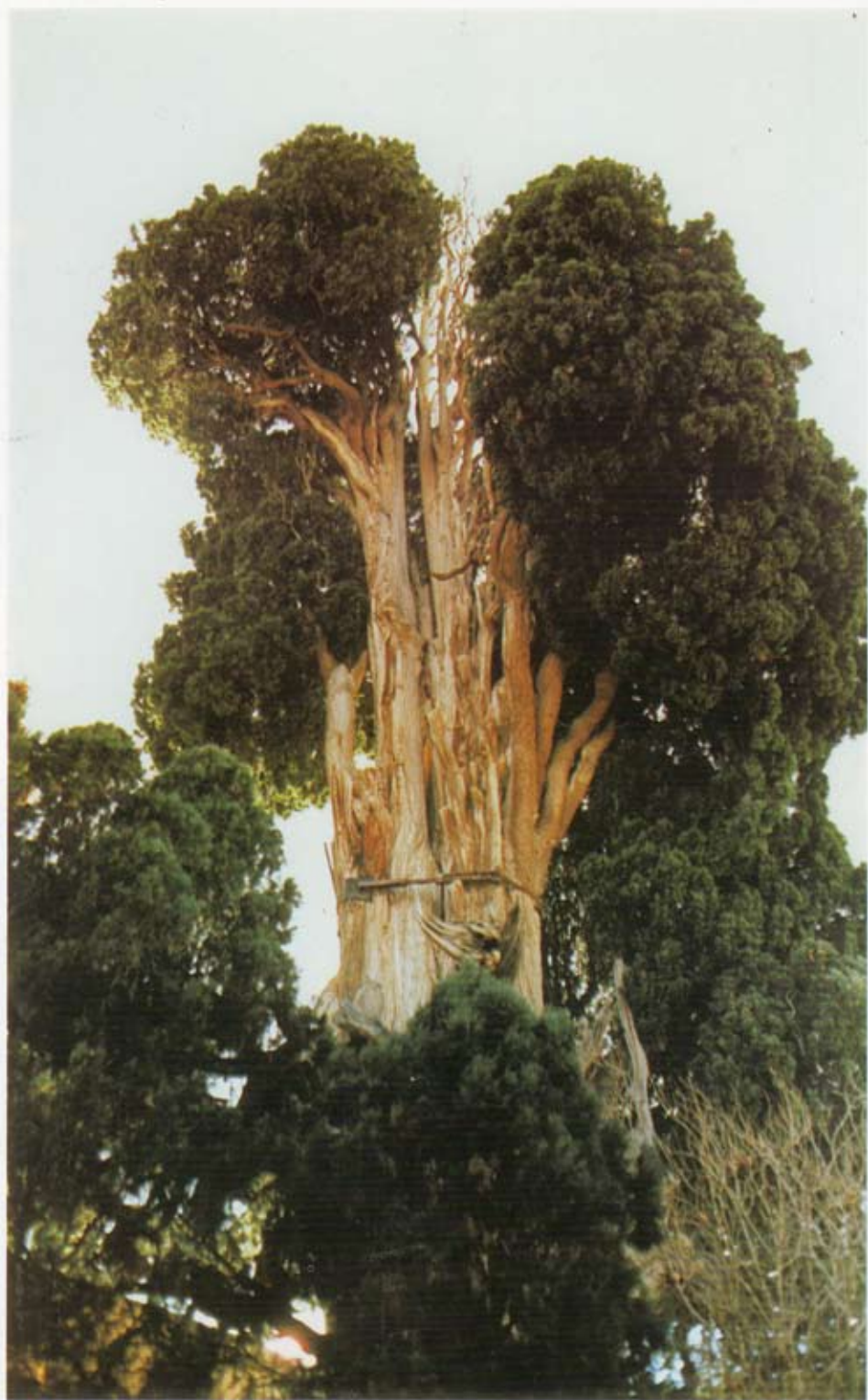
سرو کهنسال روستای چم، یزد