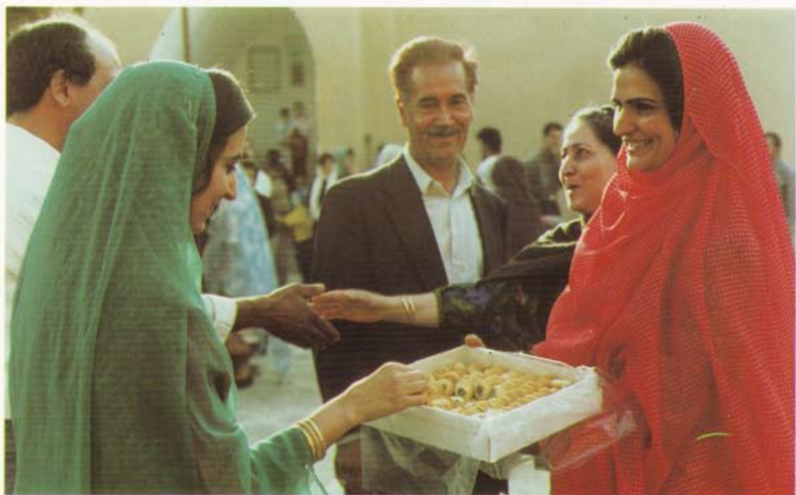
شیرینی و شادی