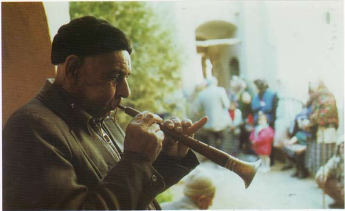
مراسم ساز و گشت در مهرگان (مهرایزد) روستای دین آباد تفت