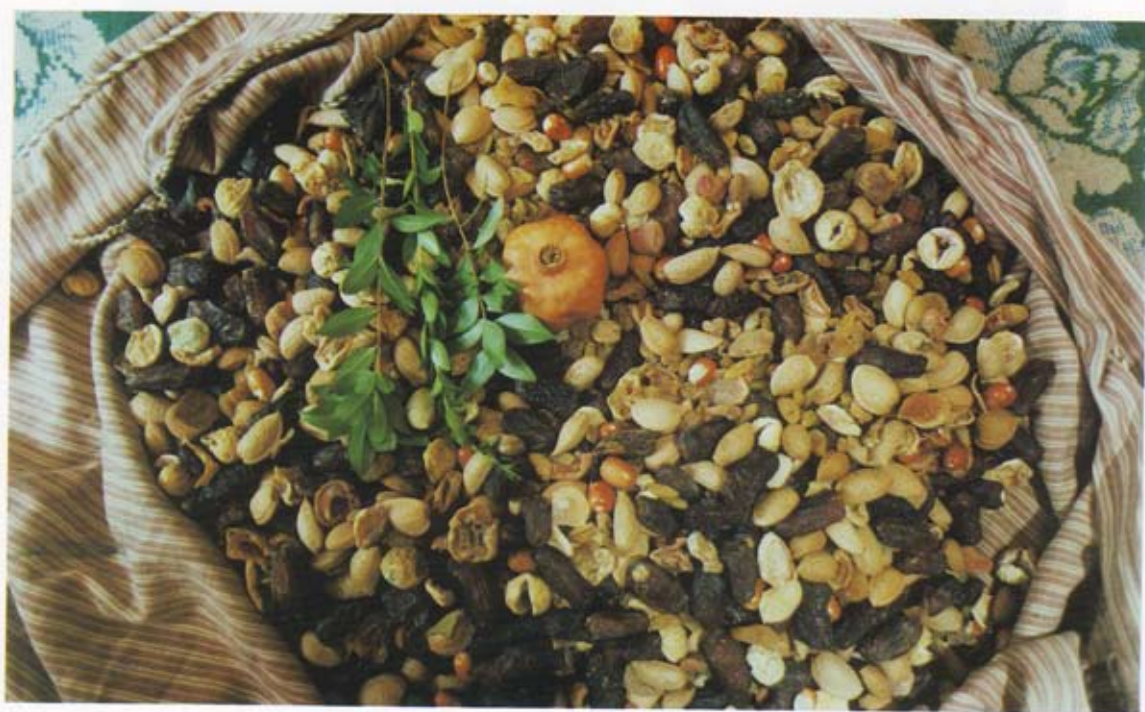
مخلوطی از میوه‌های خشک (لرک) شاخه‌های مورد