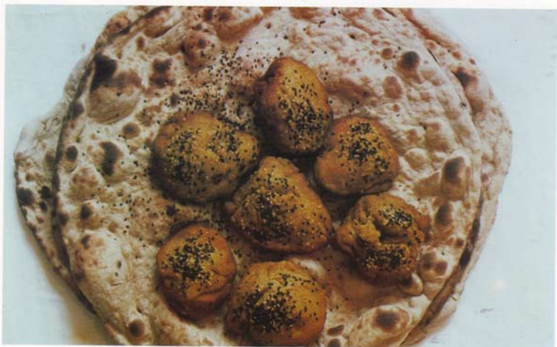
نان و کماچ در سفره مراسم آیینی